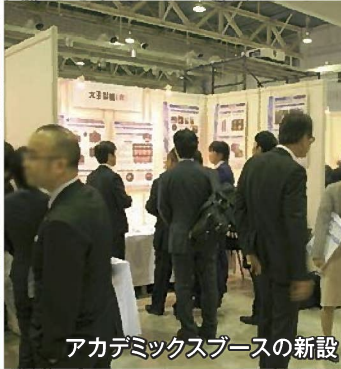
アカデミックブースの新設