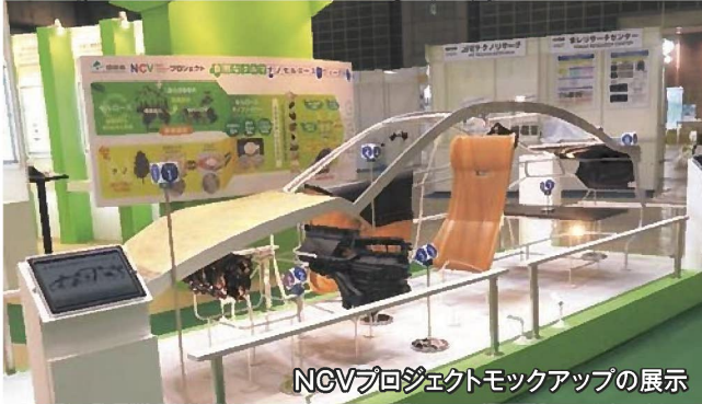
NCVプロジェクトモックアップの展示